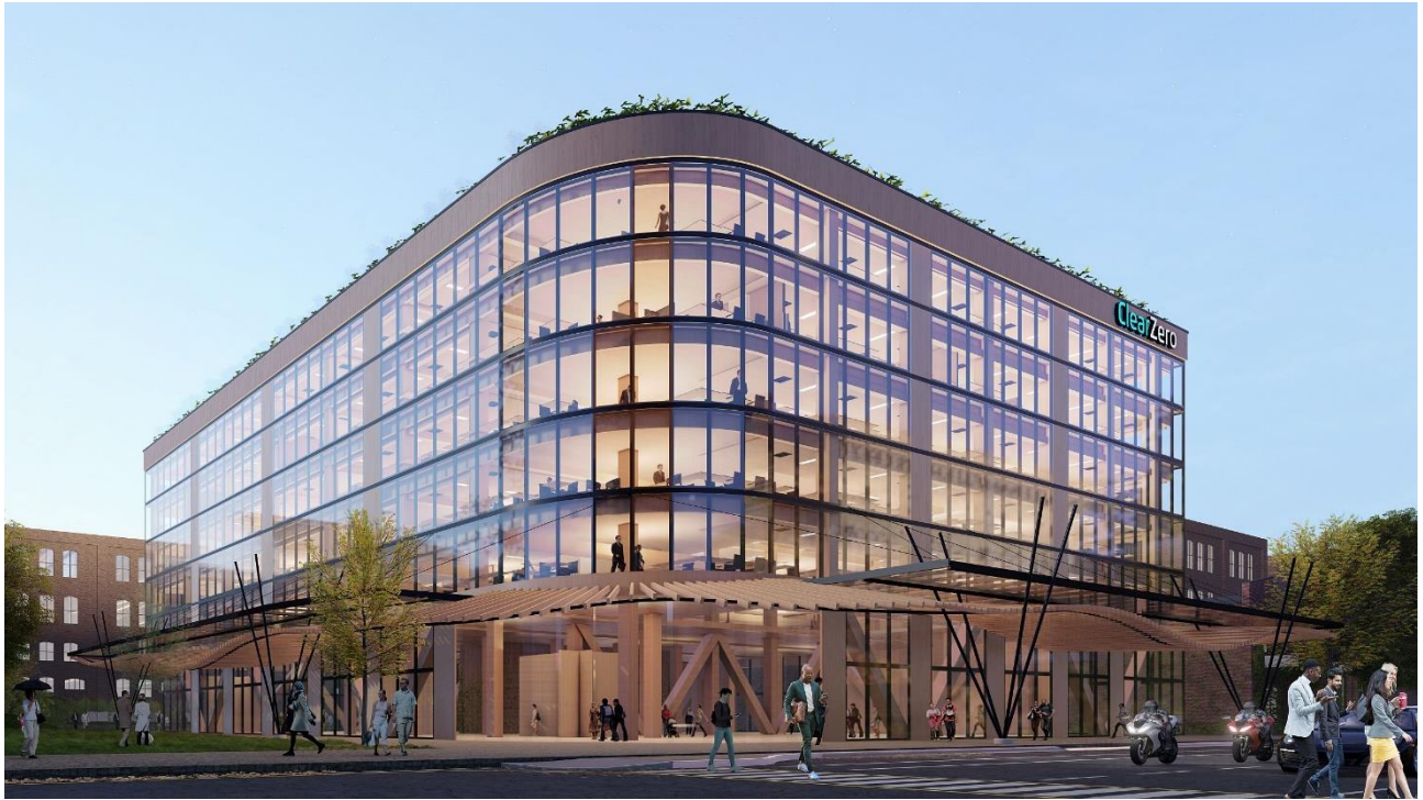
Künstlerische Darstellung des ClearZero-Archetyps (Vorderansicht)