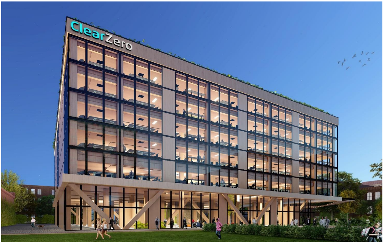
Künstlerische Darstellung des ClearZero-Archetyps (Hinteransicht)